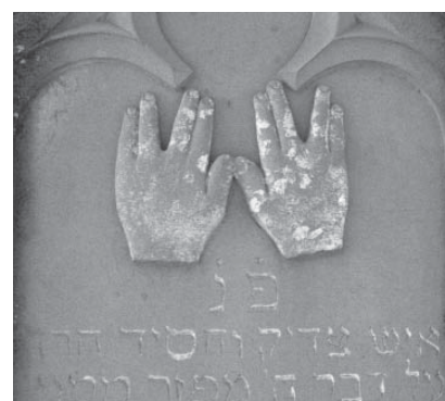
Segnende Hände. Symbol für Mitglieder aus dem Stamm der Kohanim.