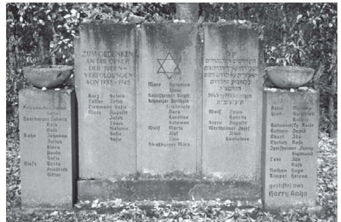
Gedenkstein für die Ermordeten.