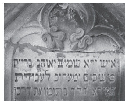
Symbolik und hebräische Inschrift.